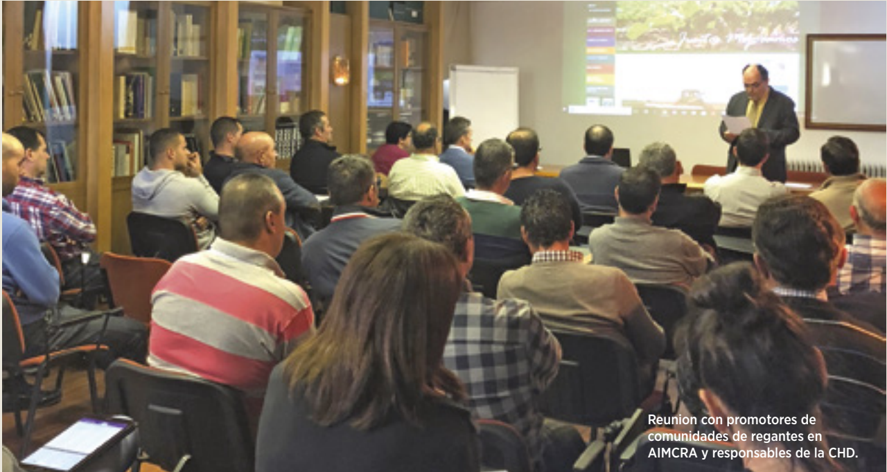
Reunión con promotores de comunidades de regantes en AIMCRA y responsables de la CHD.