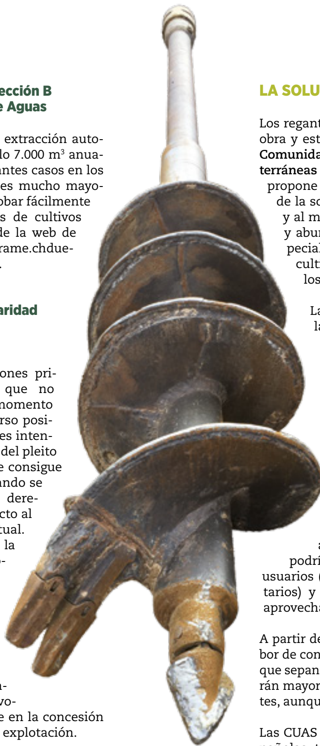
Cabeza de barrena de perforar.

Existen muchas captaciones privadas (pozos/sondeos) que no fueron inscritas en su momento en la CHD. El único recurso posible para los agricultores es intentar legalizarlas por la vía del pleito civil. En algunos casos se consigue y en otros no, si bien cuando se consigue se revisan los derechos de extracción respecto al nivel de explotación actual. La única solución sería la constitución de una comunidad de regantes de aguas subterráneas, en cuyo caso estos pozos pasarían a ser considerados como tomas con las que sí se podría regar, aunque no adquirirían derechos, siempre que se disponga de volumen de agua suficiente en la concesión de la comunidad para su explotación.